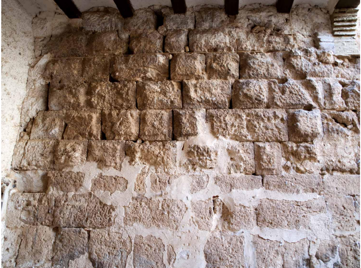
Imagen 10.- Mareca