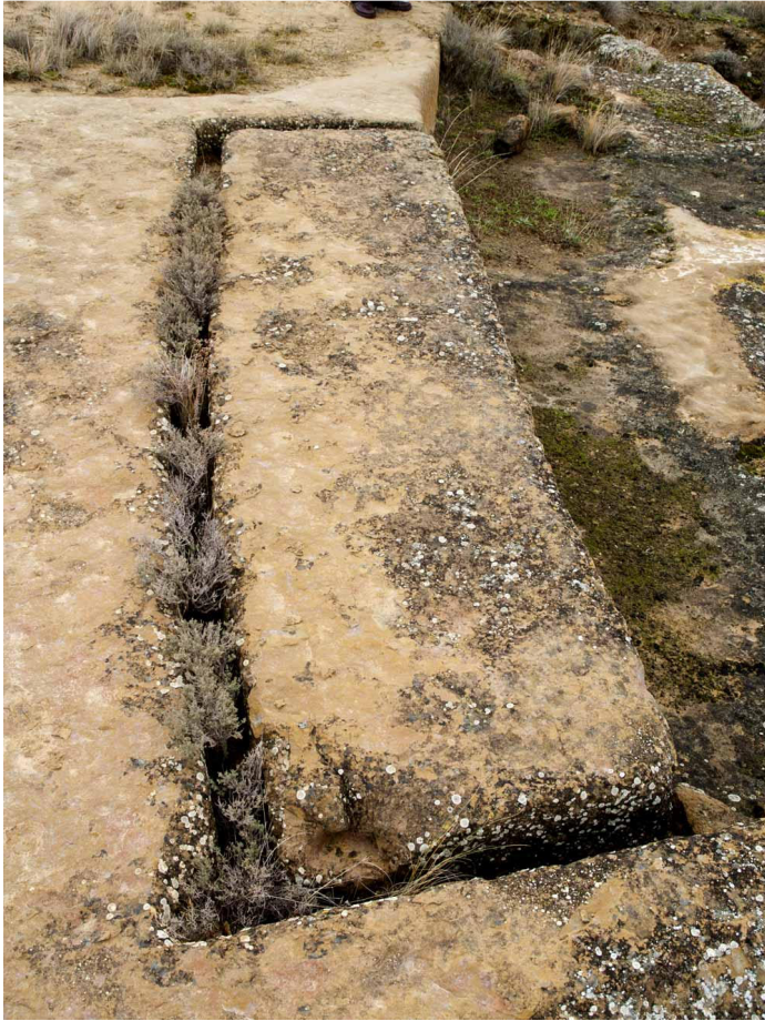
Imagen 1.- Alberuela de Tubo.