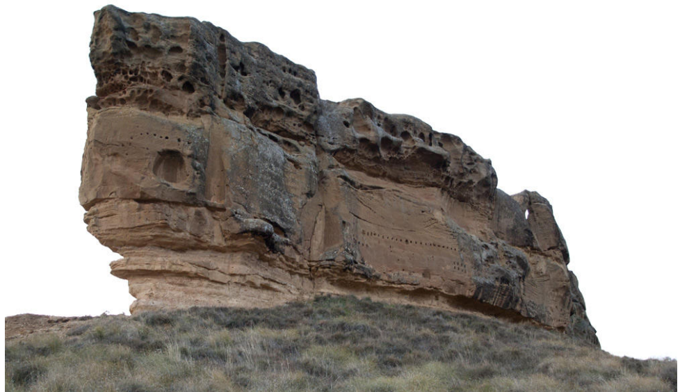
Imagen 2.- Piracés