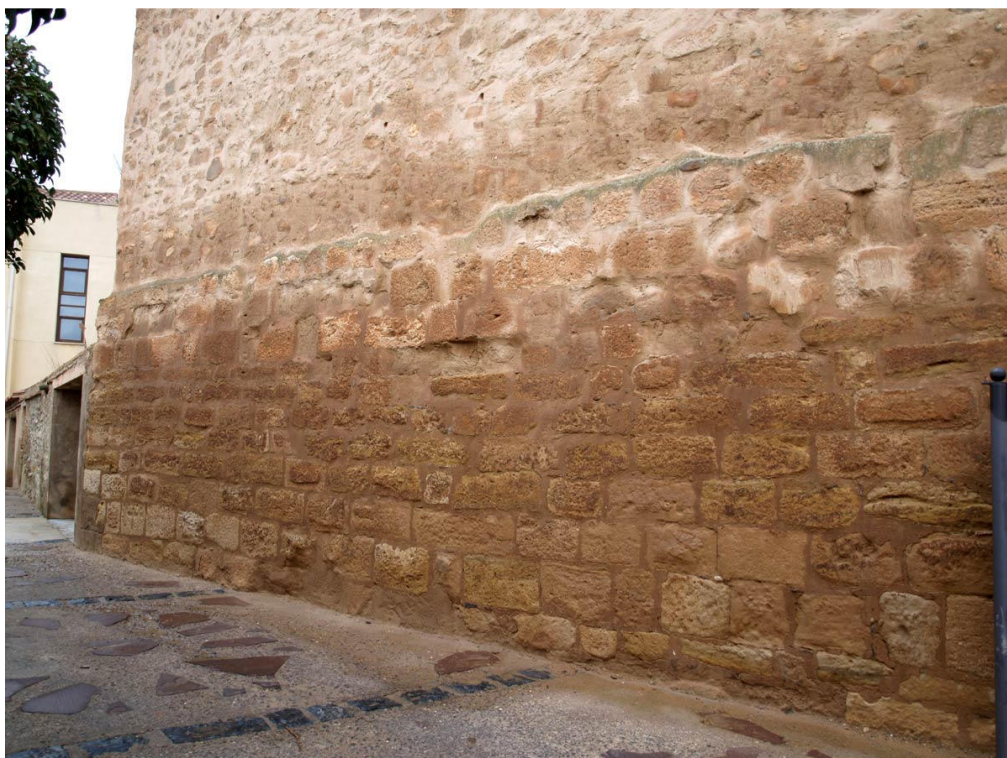
Imagen 7.- Tarazona