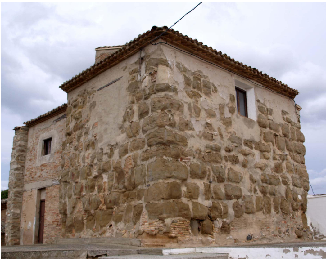
Imagen 9.- Urzante