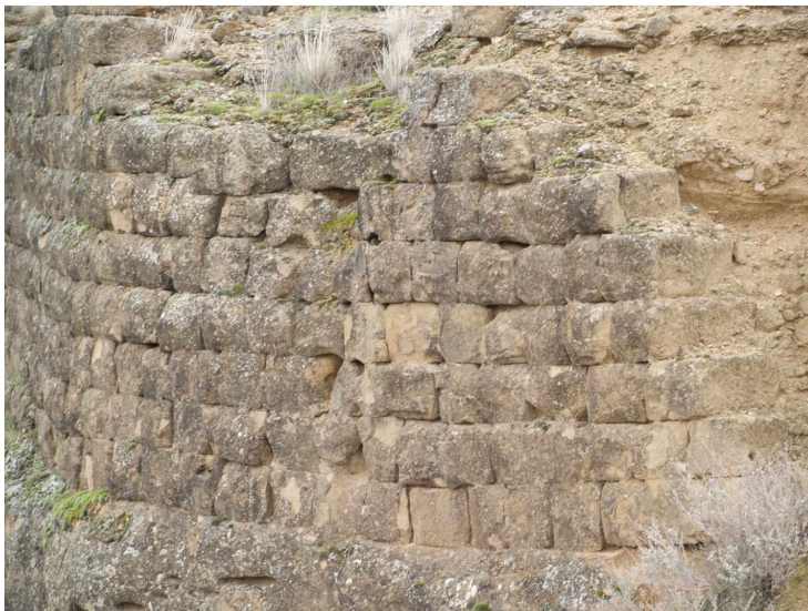
Imagen 5.- Alberuela de Tubo