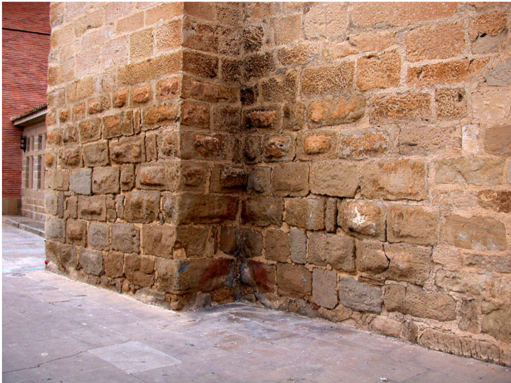
Imagen 6.- Olite