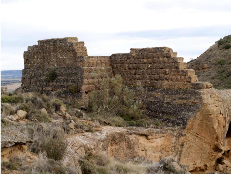
Imagen 3.- La Iglesieta de Usón